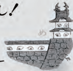
「鳥のはんじもの」一齋齋(歌川)国盛より