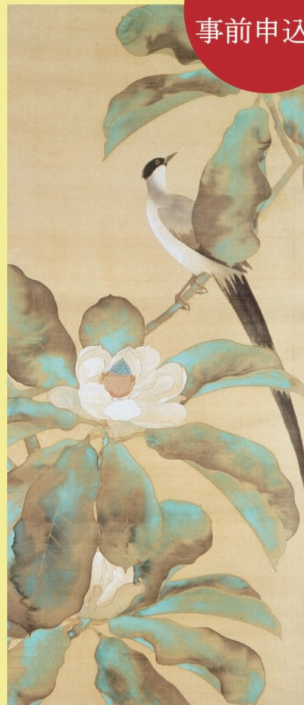
鈴木其一 朴に尾長鳥図(部分)