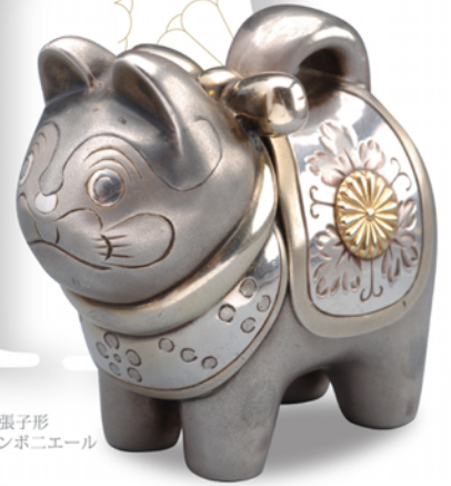
犬張子形 ボンボニエール