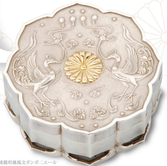
八稜鏡形鳳凰文ボンボニエール