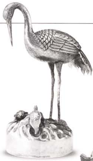
鶴亀像形ボンボニエール

手のひらにおさまる、美しい蓋付の菓子器「ボンボニエール」。そのほとんどは銀製で、我が国では主に金平糖入れとして用いられています。