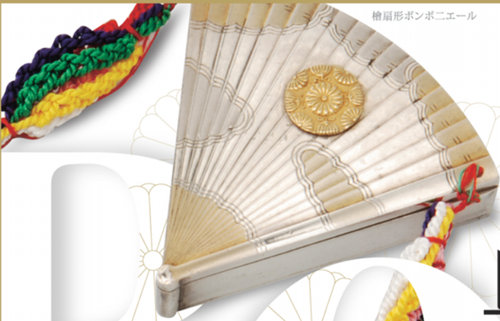
繪扇形ボンボニエール