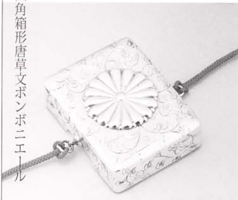
四角箱形唐草文ボンボニエール