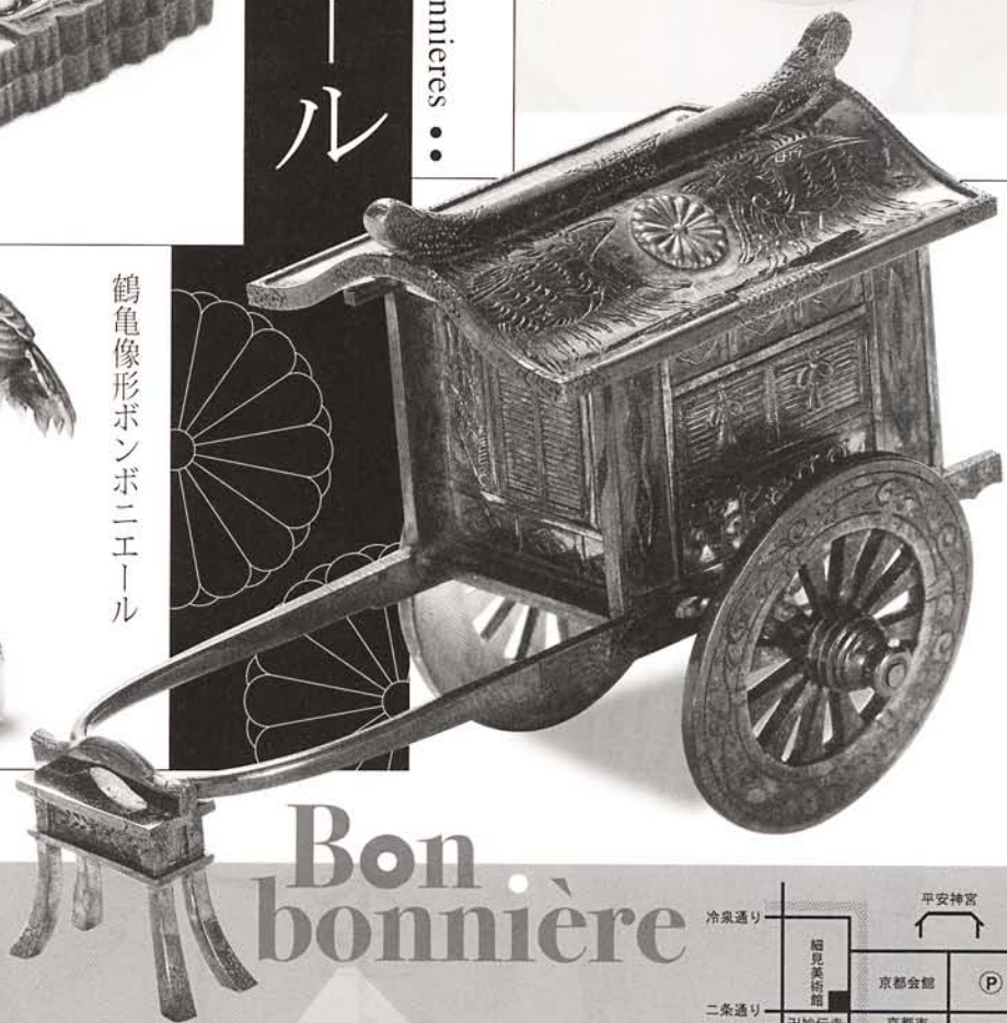
御所車形ボンボニエール