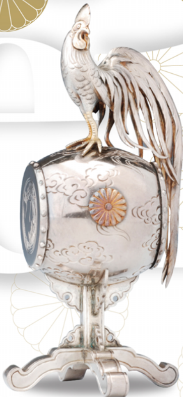
謙鼓形ボンボニエール

ご優待 一般/1,000円-800円 学生/800円-600円 本紙にて4名様まで200円引。