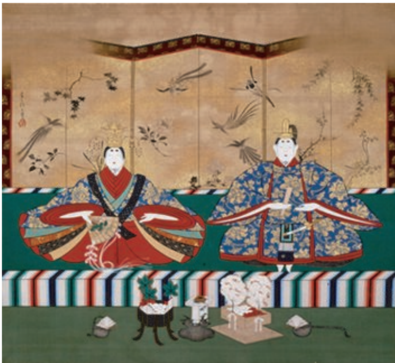
内裏雛図 田中抱二筆 個人蔵