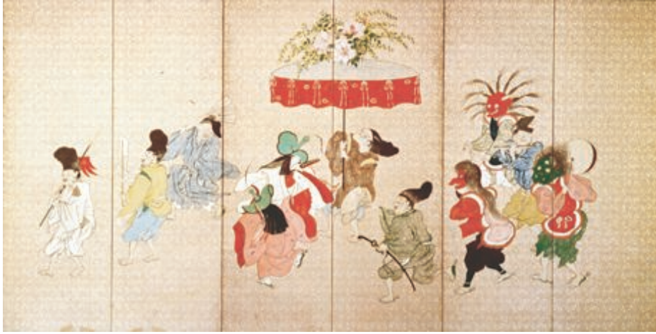
やすらい祭図屏風