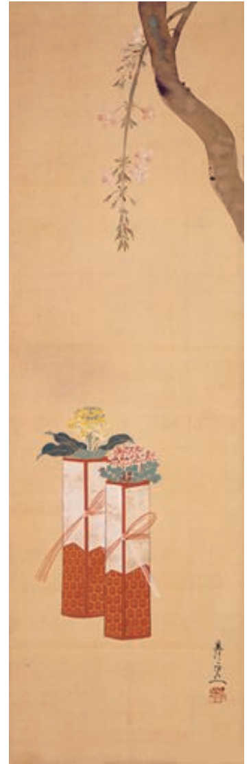
桜下花雛図 鈴木其一筆