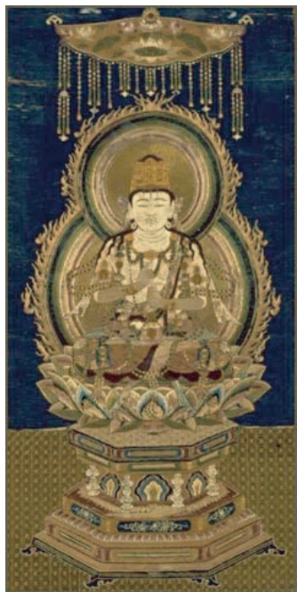
重要文化財 刺繍大日如来像