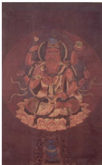
重要文化財 愛染明王像