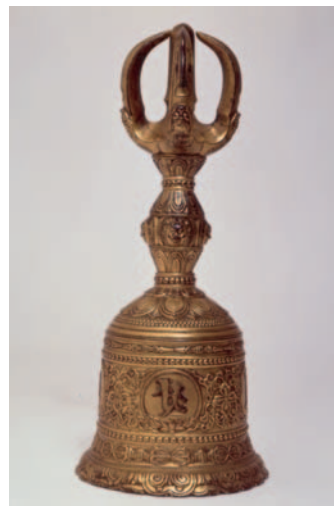
重要文化財 金銅種子五鈺鈴