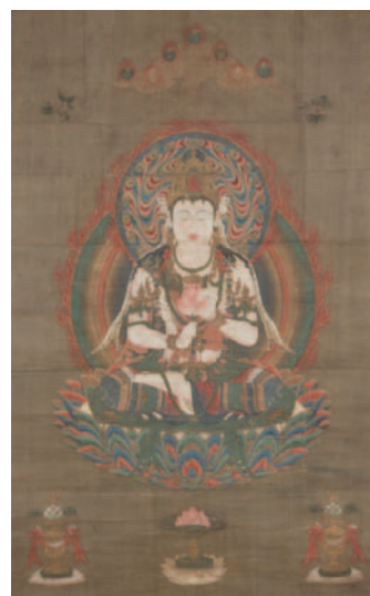
六観音のうち「聖観音」