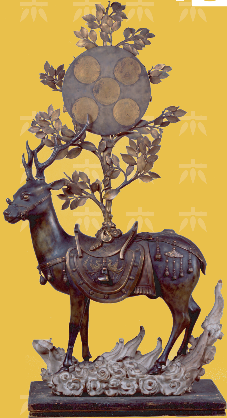
重要文化財 金銅春日神鹿御正体

平成20年 6.6(金) - 7.27(日) 休館日 毎週月曜日 (祝日の場合、翌日)