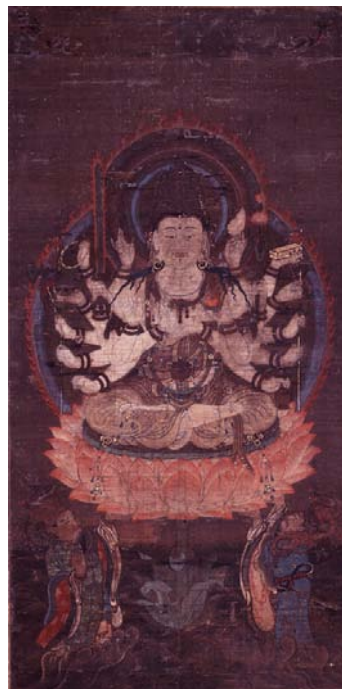
准胝観音像 後期展示