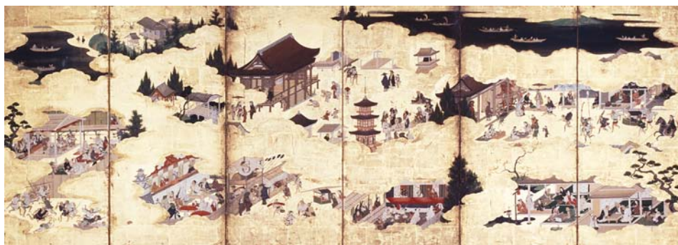
江戸名所遊楽図屏風 前期展示