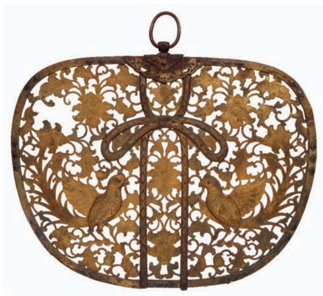
重要文化財 金銅透彫尾長鳥唐草文華鬘