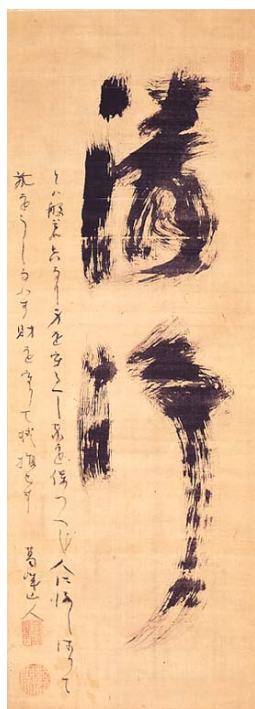
慈雲尊者筆 清浄 前期展示