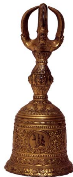
重要文化財 金銅種子五鈷鈴 ※後期展示