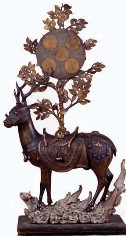
重要文化財 金銅春日神鹿御正体