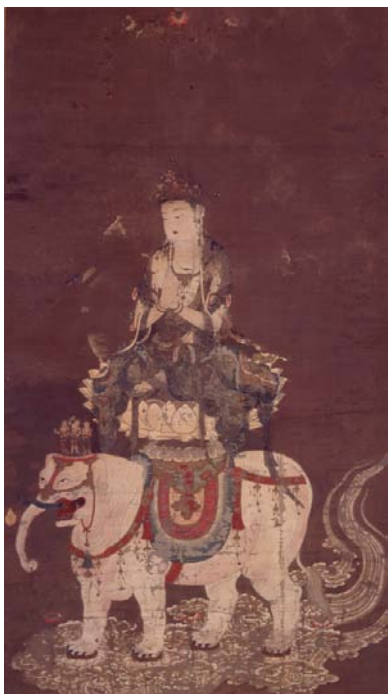
普賢菩薩像 前期展示