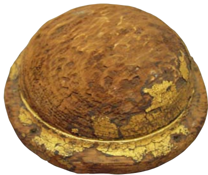
唐招提寺釘隠香合