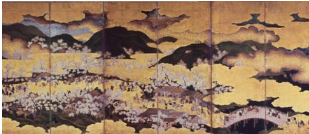
重要文化財 豊公吉野花見図屏風 後期展示