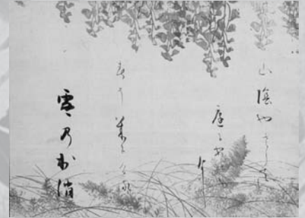
忍草下絵和歌巻断簡 宗達派下絵 本阿弥光悦書