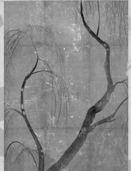
柳図香包 尾形光琳