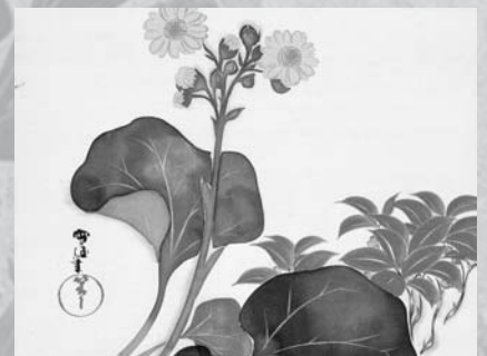
十二月草花図より 十二月 柳に椿 神坂雪佳