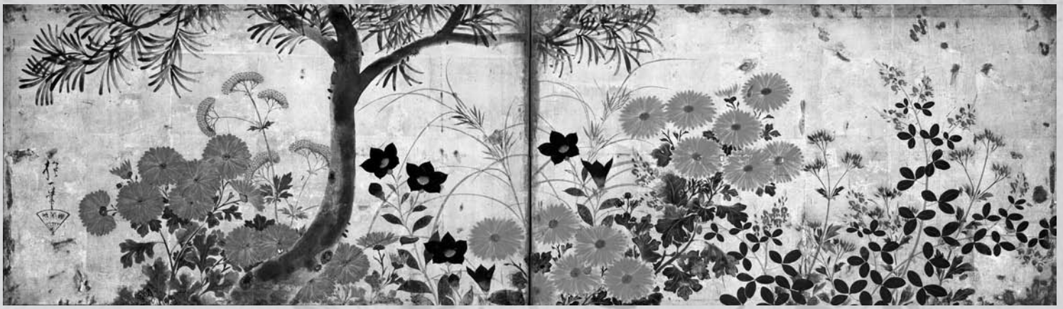
楳に秋草図屏風 酒井抱一