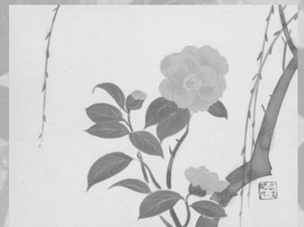
十二月草花図より 二月 石路に薔柑子 神坂雪佳