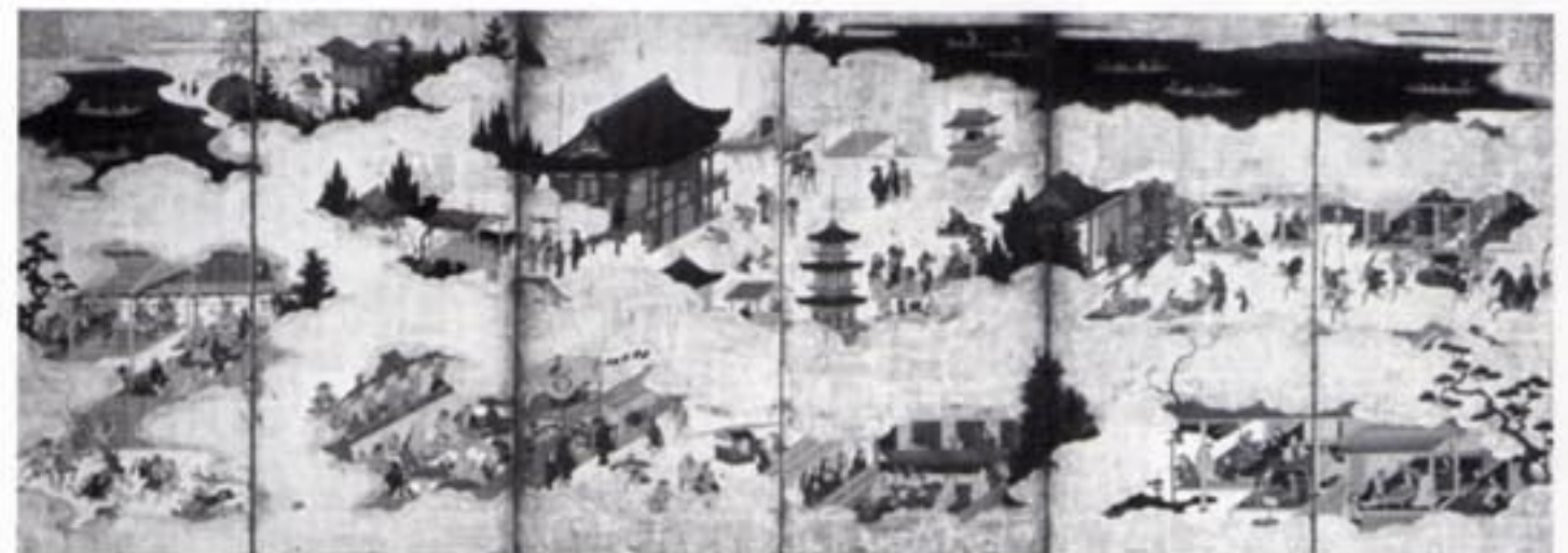
江戸名所遊楽図屏風