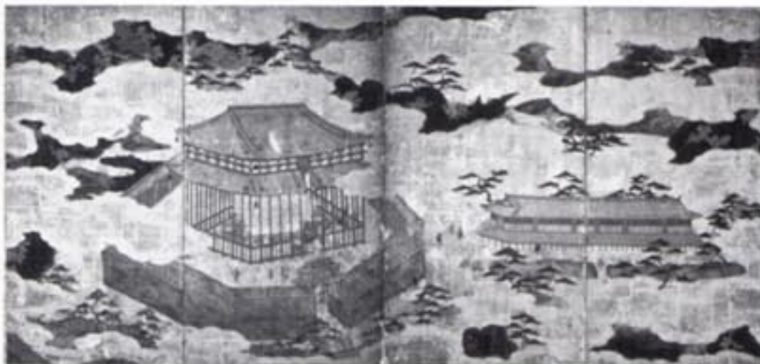
東山名所図屏風(右隻)