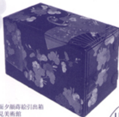
扇面夕顔葛絵引出箱 細見美術館