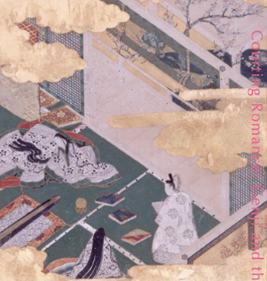
源氏物語岡崎絵(複製) 土武文有 細見美術館