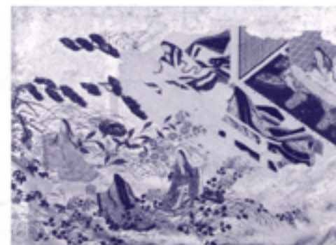
源氏物語手紙 和泉市久保惣記念美術館