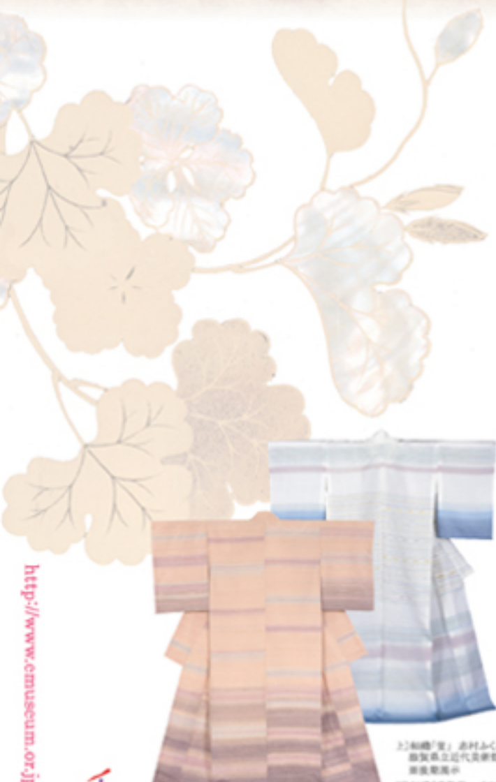
上)和織「雲」志村ふくみ 複製京立近代美術館 蔵複製展示