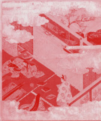
土佐光吉 源氏物語図色紙「初音」