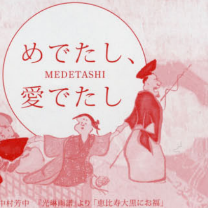
中村芳中 「光琳画譜」より「恵比寿大黒にお福」